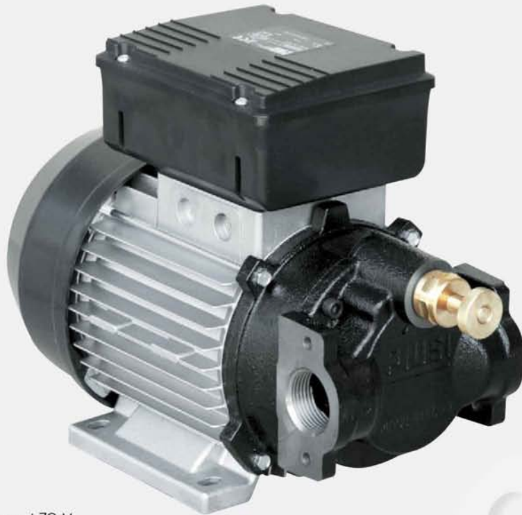
Viscomat 70 M