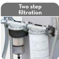
Two step filtration